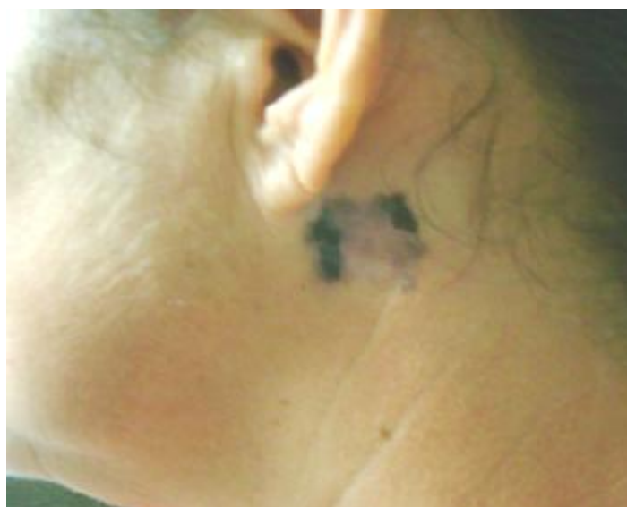
Figura 1. Melanoma: región retroauricular izquierda

Lesión de aproximadamente 2cm de diámetro, de aspecto macular, redondeada, asimétrica, con bordes irregulares, intensamente pigmentados, con una pequeña elevación del borde izquierdo y el área central sin pigmento, en regresión. No adenopatías regionales (figura 1).