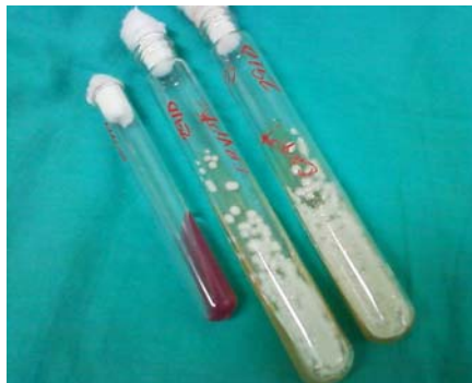
Figura 3. Colonias levaduriformes en medio de Agar Sabouraud. Urea de Christensen positiva