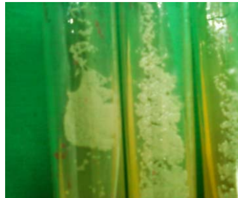
Figura 2. Colonias levaduriformes en medio de Agar Sabouraud