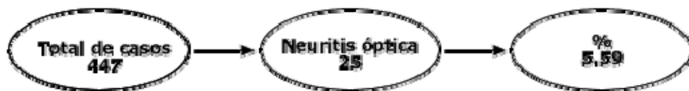
Gráfico 1. Frecuencia de neuritis óptica en la muestra

Como nuestro objetivo es que la persona que acuda a la Consulta de Baja Visión sea capaz de cumplir con la rehabilitación las metas que se ha trazado, solo consideramos rehabilitados a aquellas que lo logran (tabla 2), independientemente de que su calidad de vida mejore al mejorar su agudeza visual, es por esto que se consideraron rehabilitados 18 (76%) de los 25 discapacitados con neuritis óptica atendidos en consulta, cuatro con su corrección óptica convencional para cerca y 14 con el uso de ayudas ópticas; no se consideraron rehabilitadas siete de las 25 personas con neuritis óptica que fueron atendidas (28%), ya que no llegaron a satisfacer los objetivos perseguidos por ellas.