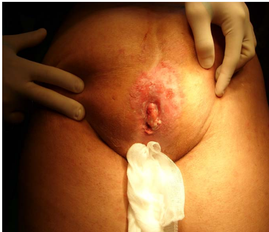
Figura 2. Aspecto clínico de la lesión en la segunda paciente. Nótese el aspecto eritemato-costroso. El diagnóstico anátomo-patológico fue de enfermedad de Bowen perianal

-Evolución: la paciente se encuentra asintomática en el momento de redactar este informe.