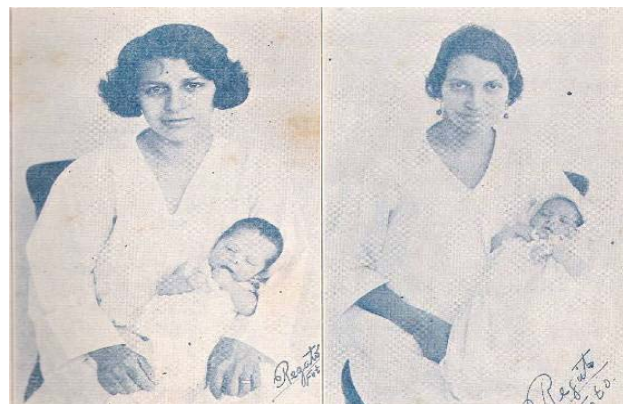
Figura 3. Primeras pacientes que parieron en el hospital