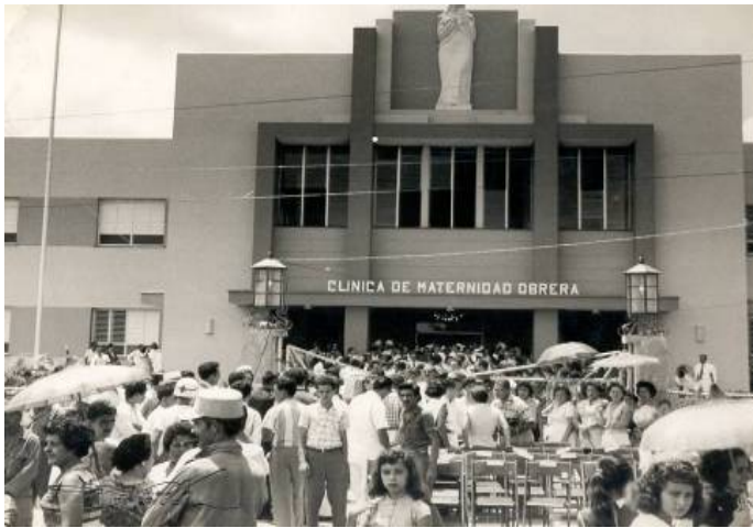
Figura 4. Acto de inauguración del hospital materno el día 25 de mayo de 1959 con el nombre de "CLÍNICA DE MATERNIDAD OBRERA"