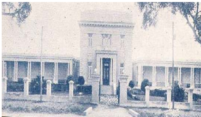
Figura 2. Vista frontal del Hospital de la Maternidad y la Infancia "Lutgarda Morales"