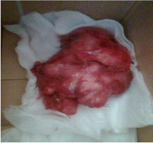
Figura 3. Pieza anatómica correspondiente al tumor retroperitoneal extraído