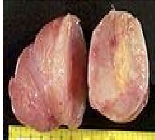
Figura 4. Tumor neurofibroma, corte visto microscópicamente por la Especialidad de Anatomía Patológica