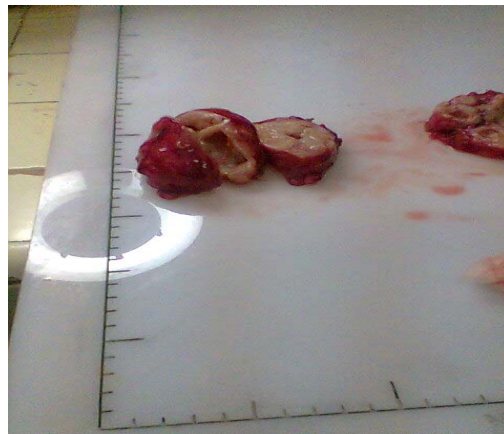
Figura 5. Tumor disecado para visión microscópica y posible análisis

- Conclusiones: el aspecto histológico es consistente con un neurofibroma. Útero y anejos normales de acuerdo a su edad.