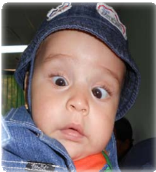
Figura 1. OD más pequeño, esotropía

Se le realizó un ultrasonido ocular en AO (figura 2).