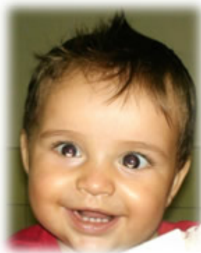
Figura 3. Después del tratamiento de rehabilitación

OI: vítreo normal, retina aplicada, nervio óptico normal, diámetro AP de 20,02mm.