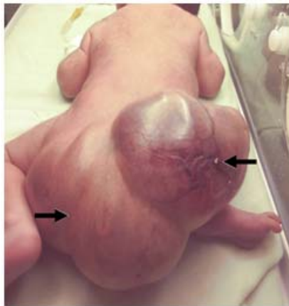
Figura 2. Muestra el área del tumor y su gran vascularización

Se realizó una tomografía axial computadorizada (TAC) simple y contrastada de abdomen y columna lumbosacra que mostró una imagen de aspecto tumoral, multiquística y tabicada, de aproximadamente 20cm de diámetro transverso, con calcificaciones en su interior, en la columna lumbosacra y órganos intrapélvicos sin alteraciones (figura 3).