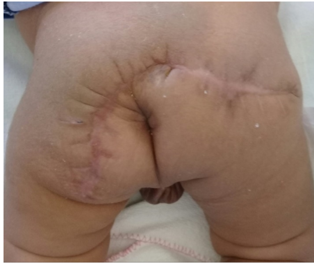
Figura 4. Estado de la región sacrococcígea tres meses después de la intervención quirúrgica

En la actualidad lleva seguimiento por un equipo multidisciplinario que incluye consultas de neurodesarrollo. Luego de tres meses el bebé se encuentra con buena salud, desarrollo psicomotor acorde a su edad y sin recidivas del tumor (figura 4).