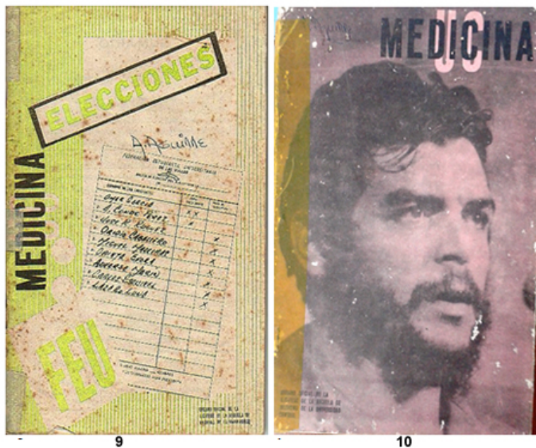
Fig. 9-10. Revista Medicina UC. 1970. Números 3 y 4